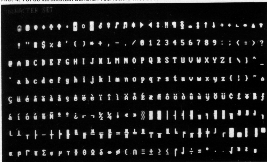
Afb. 4. Tot de karakterset behoren veel letters met accenten.

10 DIM R(5) 20 FOR N=1 TO 500 30 FOR A=1 TO 5 40 READ R(A) 50 NEXT A 60 RESTORE 70 NEXT N 80 PRINT "*" 90 DATA 1,2,3,4,5 100 END