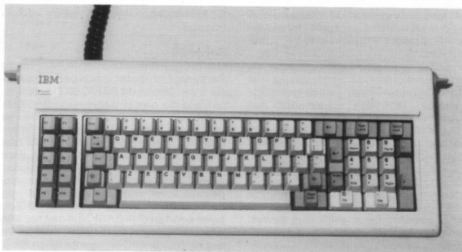
Afb. 3. Het toetsenbord met een aanzienlijke hoeveelheid speciale toetsen.

Normaal worden de toetsen op het cijfertoetsenpaneel gebruikt voor cursorbesturing, echter na het indrukken van „Num lock“ krijgen deze toetsen een numerieke functie, waarbij men ook de beschikking heeft over rekenkundige functies.