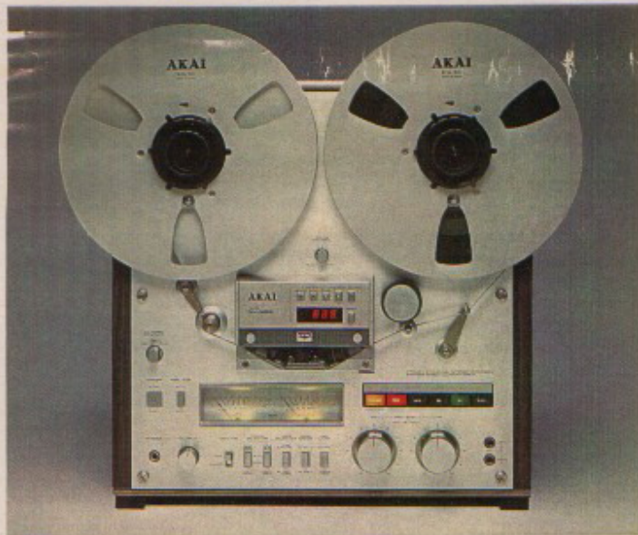
GX-625 STEREO TAPEDECK

Dit 3-motorig open spoelendeck is eigenlijk een hoofdstuk apart. Dankzij een aantal vernuftige voorzieningen kent dit tape-deck nauwelijks zijn weerga. Zo geschiedt het bandtelwerk niet meer mechanisch, maar elektronisch.