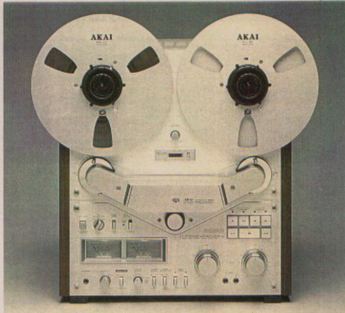
GX-636 D STEREO TAPEDECK

19 kHz pilottoon. De dolby-werking wordt daardoor niet verstoord. Een timer start-schakelaar zoals bij de GX-636 D ontbreekt echter bij dit deck.