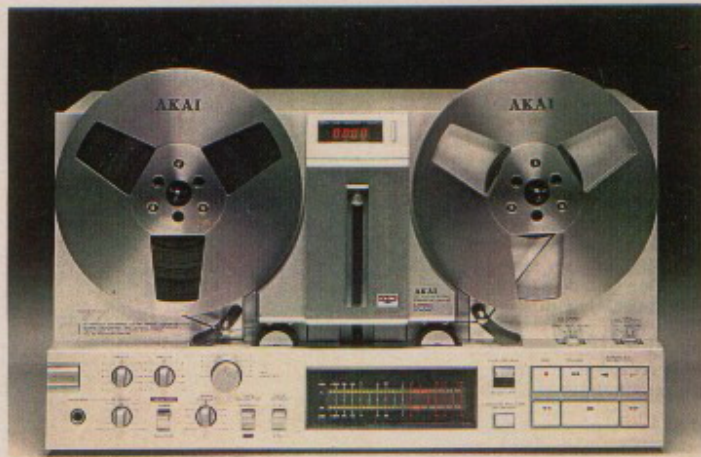
GX-77 STEREO TAPEDECK.